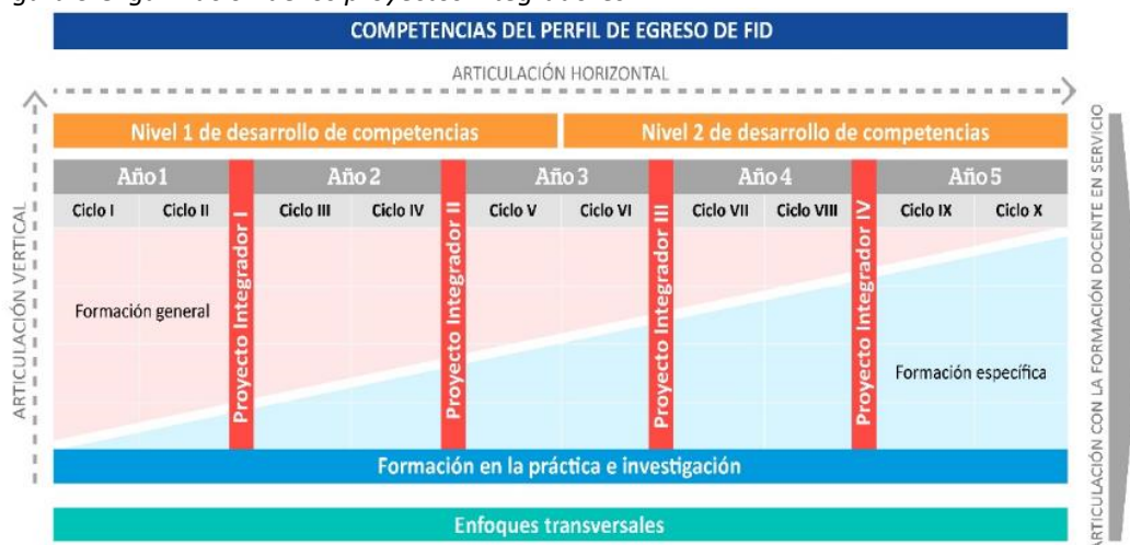
Figura 5 Organización de los proyectos integradores