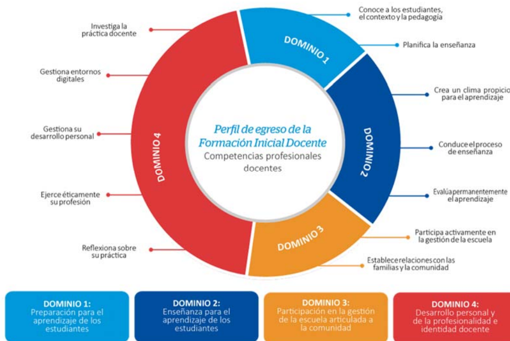
Figura 1 Esquema del Perfil de egreso de la Formación Inicial Docente

El Perfil de egreso incorpora competencias vinculadas a la formación integral que requieren los docentes en el siglo XXI. Estas son de naturaleza transversal a las competencias profesionales docentes presentadas en el MBDD. Son esenciales para la construcción de la profesionalidad e identidad docente en la Formación Inicial Docente. Para efectos de organización y coherencia del Perfil de egreso, estas se incluyen en el dominio 4 establecido en el MBDD, al que se le ha agregado el término personal. Tales competencias se orientan al fortalecimiento del desarrollo personal, a la gestión de entornos digitales y al manejo de habilidades investigativas que le permitan reflexionar y tomar decisiones para mejorar su práctica pedagógica con base en evidencias.