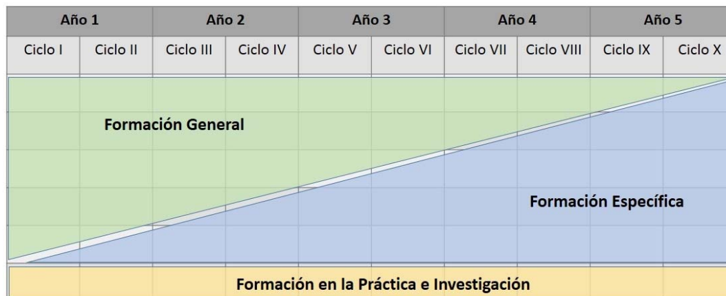
Figura 3 Componentes curriculares de la Formación Inicial Docente

Esta forma de organización contribuye a la formación integral del estudiante de FID desde una visión sistémica y coherente donde ya no se trabajan contenidos atomizados, sino que se promueve el desarrollo sinérgico de las competencias profesionales docentes del Perfil de egreso.