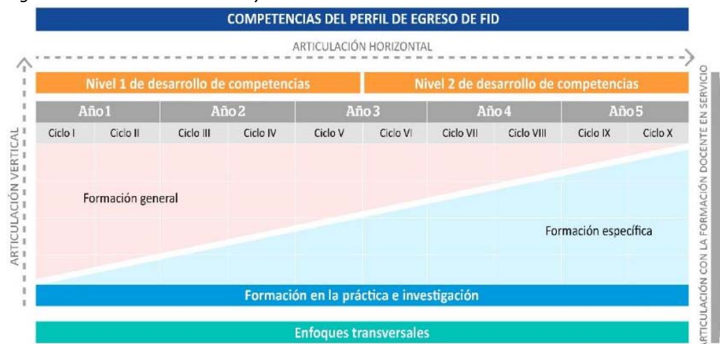
Figura 4 Articulación horizontal y vertical del DCBN de Formación Inicial Docente